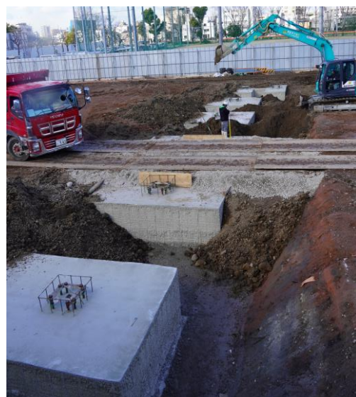
⑥b 2024.3.2 (土) 連絡通路 埋戻し