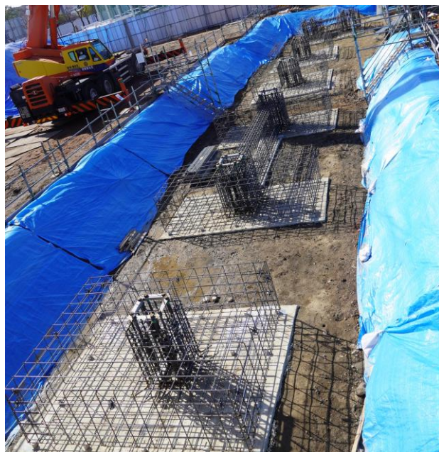
④b 2024.2.8 (木) 連絡通路 基礎工事 ：フーチング&柱脚配筋、アンカーボルトセット