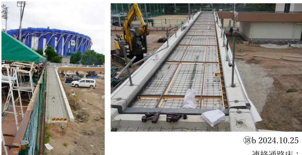
⑩b 2024.10.25（金）鉄骨階段設置 連絡通路床：人工木デッキ敷き込み アルミ手摺設置、照明用ポール設置