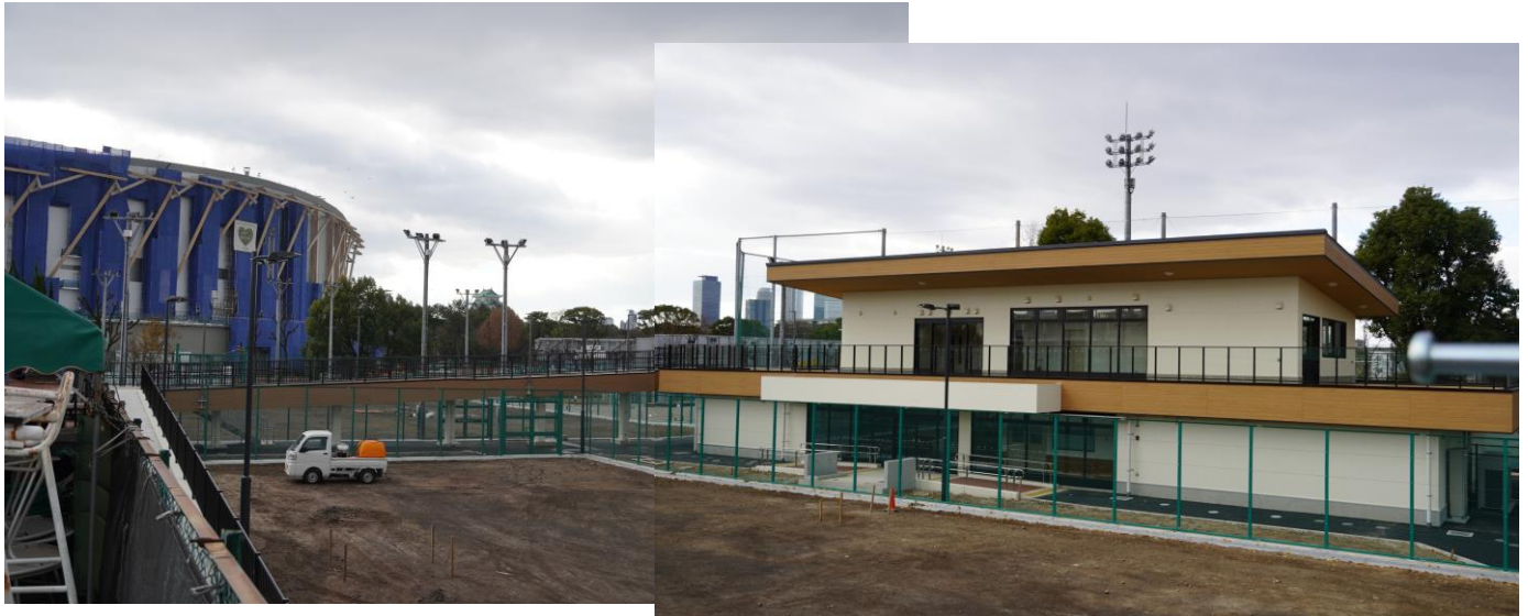
①9b 2024.12.28 (土) ネットフェンス設置